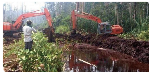
週邊運河指環繞人工林邊界的運河

泥炭地最佳管理模式的成果將會遞交給印尼政府，並與其他企業及當地社區分享。期望透過保護泥炭地及預防森林大火